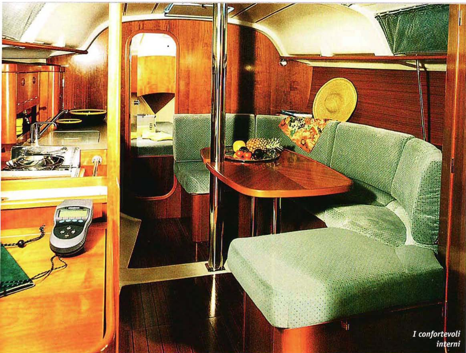
I confortevoli interni

cioletti, sia i segni sul gelcoat nei pressi dei punti più sollecitati indicano una lieve tendenza alla deformazione che non deve preoccupare più di tanto.